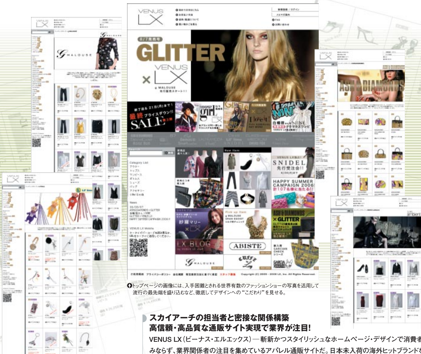
①トップページの画像には、入手困難とされる世界有数のファッションショーの写真を活用して流行の最先端を盛り込むなど、徹底してデザインへの“こだわり”を見せる。